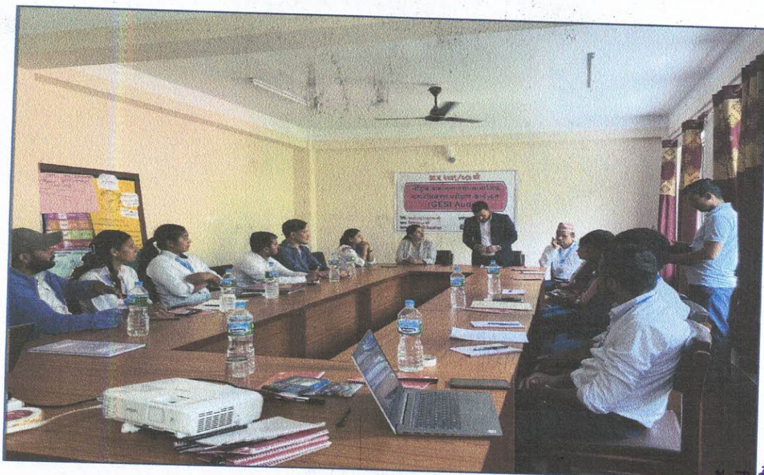
तस्विर: उद्घाटन र समापन समारोह