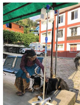
तस्विर:कुकरमा ट्युमरको सफल शल्यक्रियाको केहि झलकहरु