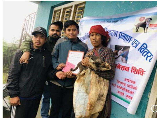
तस्विर:कुकर बिरालो दर्ता अभिलेखीकरण प्रमाण-पत्र वितरण तथा निः शुल्क रेबिज विरुद्धको भ्याक्सिनेशन शिविर