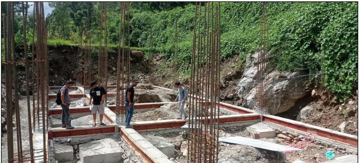
तस्विर: किस्पाड बहुप्राविधिक शिक्षालयको भवन निर्माण कार्यको प्राविधिकहरुद्वारा अनुगमन